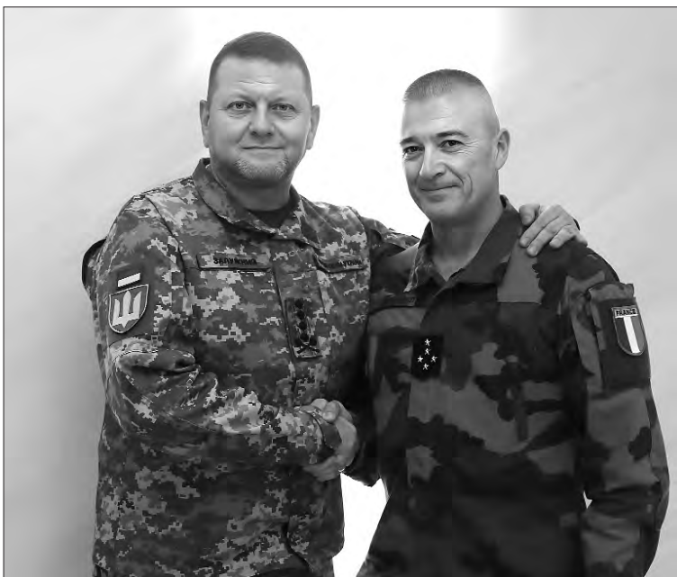
Фото зі сторінки Валерія Залужного в Твіттері.

«З генералом Бюркаром провели змістовні переговори. Ознайомив з ситуацією на фронті. Детально зупинився на потребах України в артилерійських снарядах та інших боєприпасах, протиповітряній обороні та винищувачах F-16», — написав він.